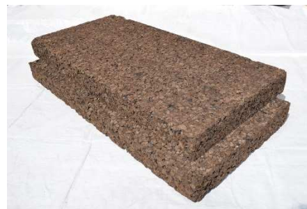
→ Panneau de liège \lambda = 0.040