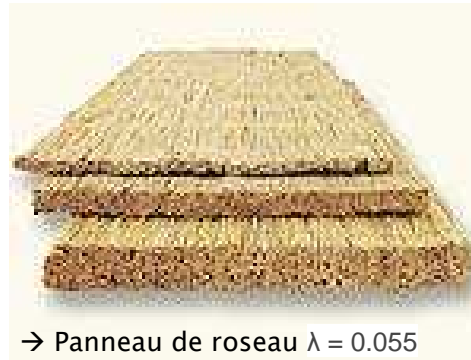
→ Panneau de roseau \lambda = 0.055